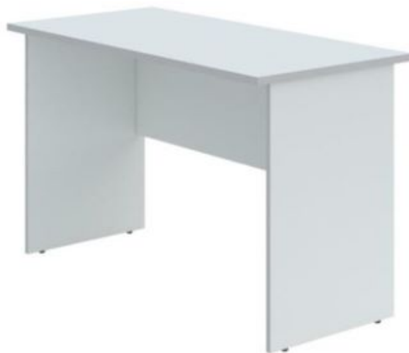
Стол письменный (ЛК-1200 С, ЛК-1500 С) ГОСТ 16371-2014