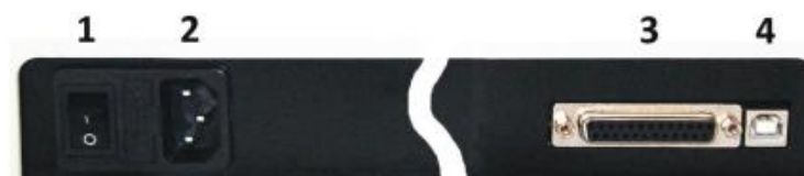
Рисунок 6 - Задняя панель прибора.

Kin5300 – программа кинетического анализа. Измерение образца на одной заданной длине волны, с заданным периодом в течение заданного промежутка времени. Может быть установлена задержка начала измерения на определенное время. При задании параметров измерения, могут быть введены коэффициенты для пересчета оптической плотности в концентрацию.