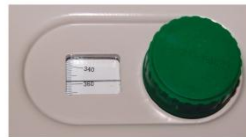
Рисунок 4 - Узел установки длины волны.

ющихся на индикаторе. В режиме F прибор запоминает значение фактора и переводит прибор в режим расчета концентрации C , значение которой будет рассчитано по формуле Cx = Ax \cdot F .