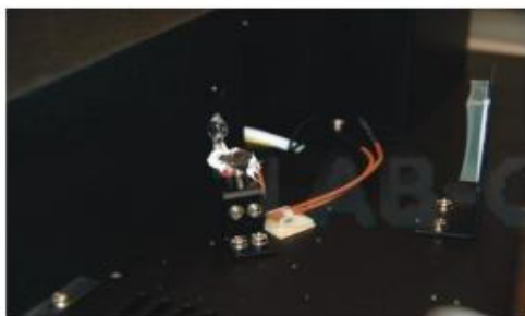
Рисунок 7 - Крепление галогенной лампы.