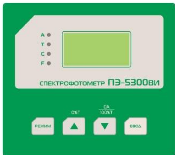
Рисунок 2 - Панель управления спектрофотометра ПЭ-5300ВИ.

Кнопка РЕЖИМ : производит переключение режимов.