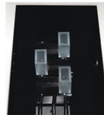
Рисунок 5 - Установка кювет в шахматном порядке.

Кюветы в кюветодержателе можно располагать, не ухудшая метрологических характеристик, в шахматном порядке. Это облегчает процесс установки кювет в кюветодержателе (Рисунок 5).