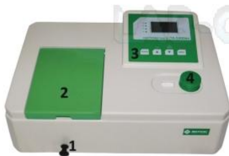
Рисунок 3 - Спектрофотометр ПЭ-5300ВИ.

Обозначения: 1 - ручка перемещения кювет; 2 - крышка кюветного отделения; 3 - панель управления; 4 - ручка установки длины волны.